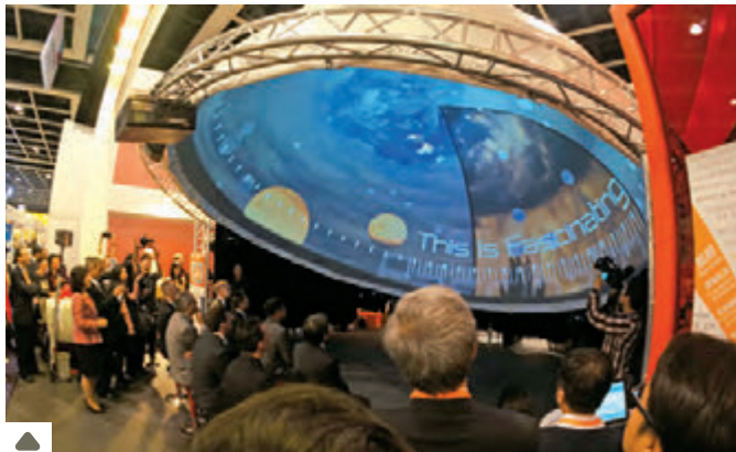
project: syntropy 新一代沉浸式全球幕娱乐剧场