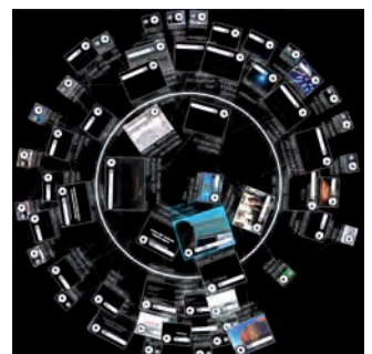
project: syntropy's 互动全球幕剧场界面，应用复杂数据动态内容浏览

科技馆 - 博物馆 - 主题公园 - 天文馆 - 商展 - 现场活动 - 节日庆典 - 产品推广