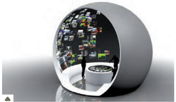
project: syntropy's 互动全球幕动态内容浏览器