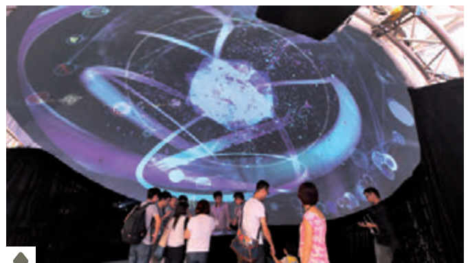
project: syntropy's 沉浸式全球幕娱乐剧场，配有互动多点触控圆桌，适用于文化，休闲，活动，展会等