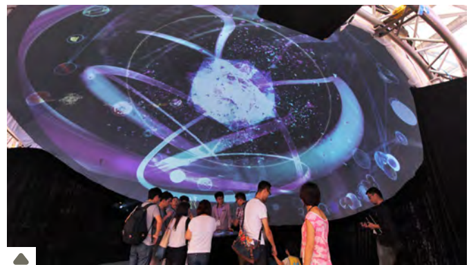
project: syntropy's Immersive Fulldome Entertainment mit interaktivem runden Multitouchtisch für Kultur, Entertainment, Event und Messe.