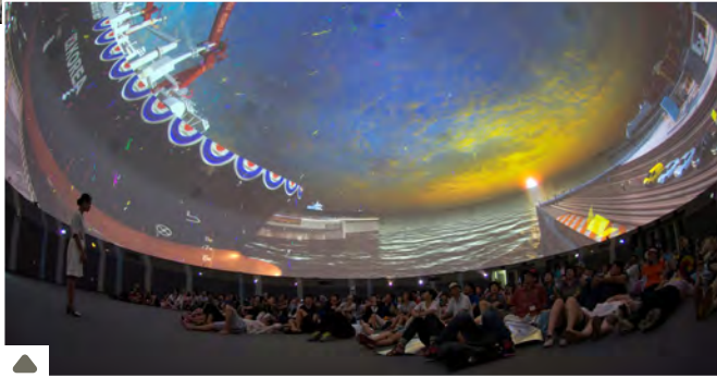
Hi-End large-scale Fulldome Entertainment für EXPO 2012, Südkorea

project: syntropy (Deutschland - Schweden - Shanghai - Taiwan - Singapur) entwickelt immersive interaktive Projektionssysteme für Simulation-, Training- und Entertainment. Langjährige Erfahrung aus über 150 weltweit realisierten Projekten bilden die Basis unserer schlüsselfertigen hochskalierbaren Fulldome-Attraktionen.