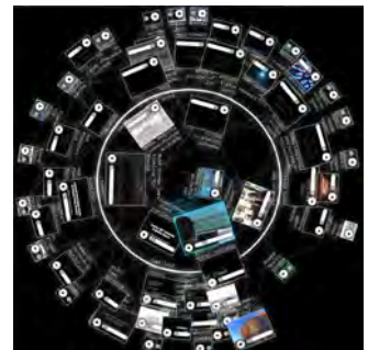
project: syntropy's interaktive Fulldome Software für dynamisches Content-browsing in komplexen multimedialen Datenbanken

Science Center - Museum - Themenpark - Planetarium - Messe - Event - Festival - Promotion