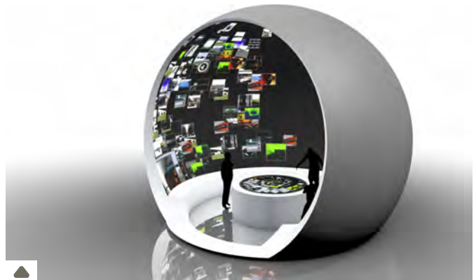
project: syntropy's dynamischer Contentbrowser im interaktiven Fulldome