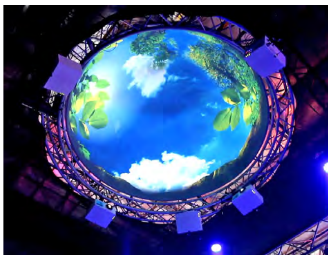
project: syntropy's Next Generation Immersive Fulldome Entertainment für Messen (PALM EXPO, Mumbai)